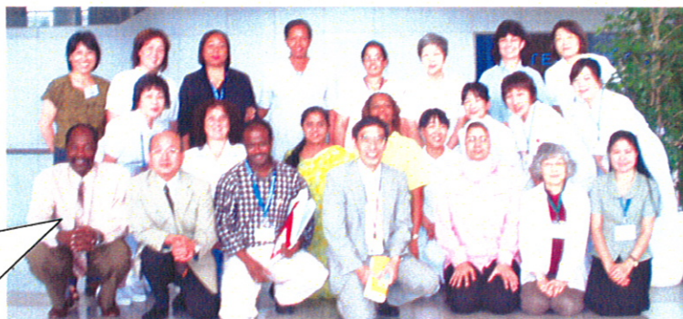
エントランスで別れを惜しんでの記念撮影