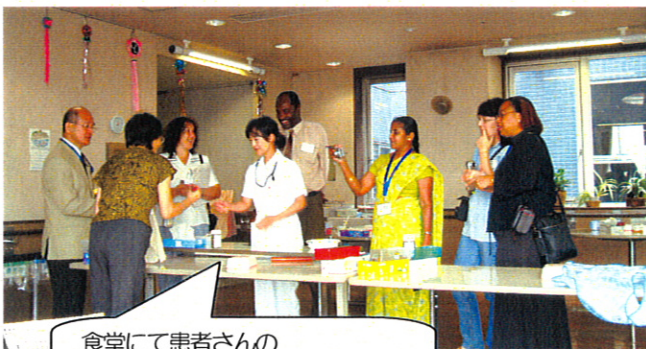
食堂にて患者さんのデイリープログラムの説明中

短い時間でしたが、同じ看護を志している世界の仲間と交流が図れたことに、私達自身が学ぶことの多い一日でもありました。