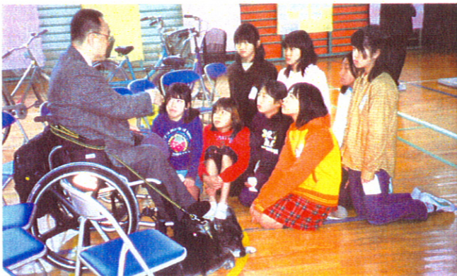
江戸川区区内小学校にて、子どもたちに囲まれて