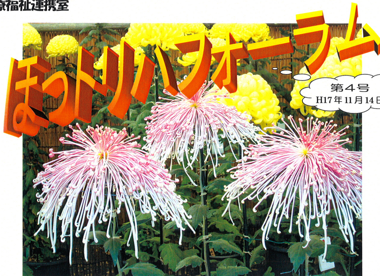
「秋日 浅草寺菊花展」