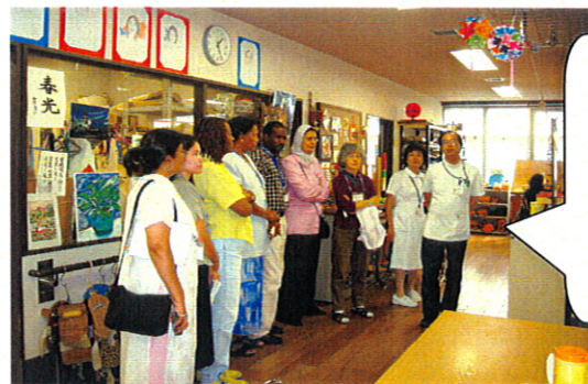
作業療法室の力作に魅入っています♪