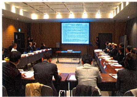
準備会(上)と懇親会(下)の様子